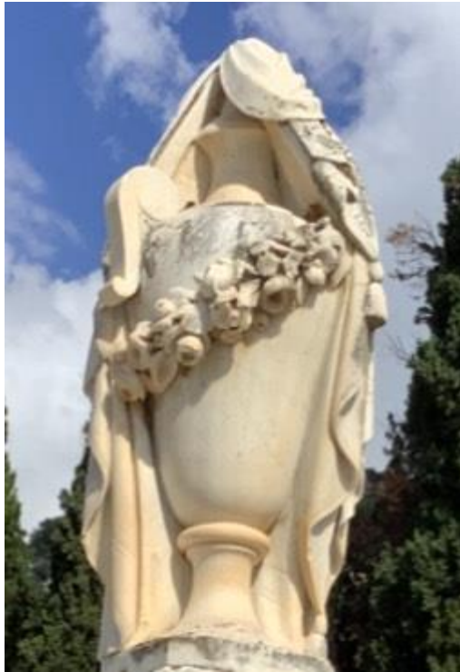
Εικ. 7. Λεπτομέρεια της εικ. 1: η τεφροδόχος ως επίστεψη της στήλης

Για παράδειγμα στον Δράπανο, από παρόμοια τεφροδόχο επιστέφεται η στήλη στον τάφο Ανδρέα Χριστοδουλάτου, ο οποίος ετελεύτησε το 1887, και είναι επίσης ανυπόγραφη. Ο πρώτος νεκρός και στους δύο τάφους ετελεύτησε το 1887, οπότε δεν αποκλείεται οι δύο στήλες να είναι έργα του ίδιου καλλιτέχνη. Πάντως για σίγουρα αποτελέσματα είναι απαραίτητη η μελέτη παρόμοιων μνημείων και σύγκριση κυρίως με μνημεία στο Α΄ Νεκροταφείο Αθηνών.