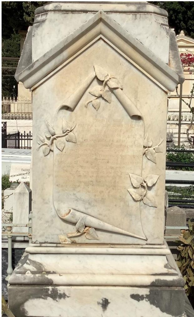
Εικ. 5, λεπτομέρεια της εικ. 4: η πρόσθια πλευρά με την κύρια επιγραφή.

Οι τέσσαρες πλευρές της στήλης καλύπτονται από επιγραφές. Στην μπροστινή πλευρά, μέσα σε ανάγλυφο πάπυρο στερεωμένο με κλαδιά τριανταφυλλιάς, είναι χαραγμένη η εξής