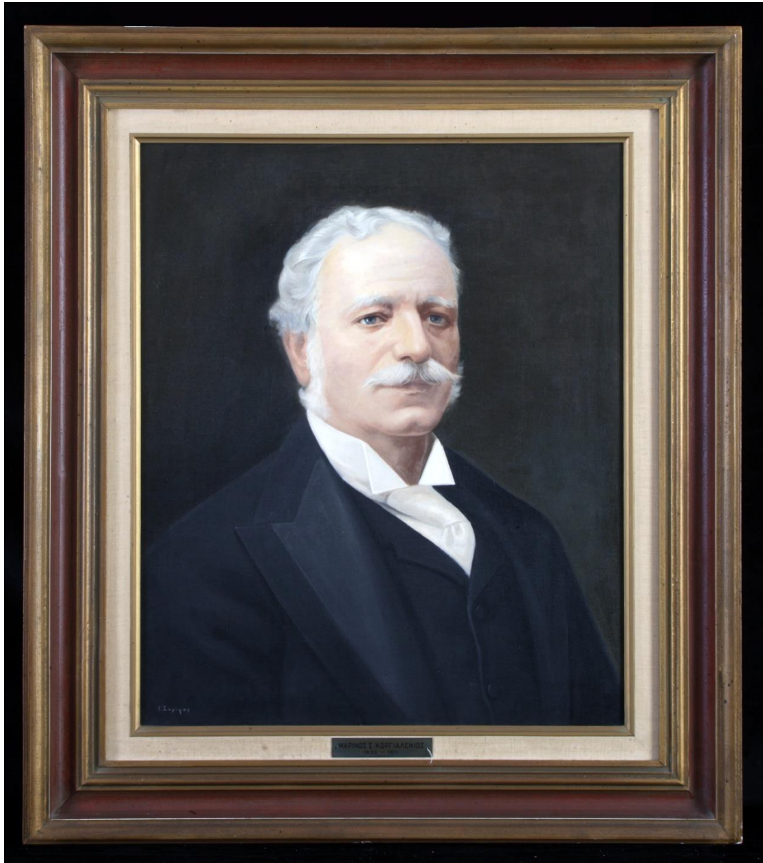
Εικ. 2. Γιώργος Συρίγος, Προσωπογραφία Μαρίνου Κοργιαλένιου , ελαιογραφία σε καμβά, 59x49 εκ.

κερδίζει μια ανεπαίσθητη μεταφυσική αύρα, αλλά χάνει σε πλαστικότητα και εκφραστικότητα. Η υπογραφή του καλλιτέχνη βρίσκεται κάτω αριστερά: Γ. Συρίγος.