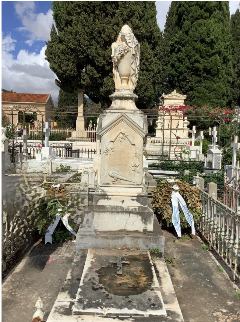
Εικ. 4. Άγνωστος, Ταφικό Μνημείο Οικογένειας Κοργιαλένιου , μετά το 1887, λευκό μάρμαρο, ύψος περ. 2,45 μ., Αργοστόλι, Νεκροταφείο Δραπάνου

Το ταφικό μνημείο της οικογένειας Κοργιαλένιου στον Δράπανο.