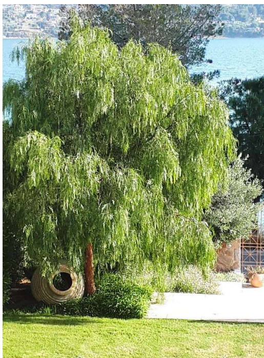
Δέντρο ψευδοπιπεριάς όπως αυτά που έχουν φυτευτεί στο τουριστικό λιμάνι της Αγίας Ευφημίας