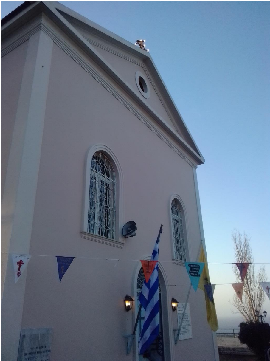
Φώτο: Εξωτερικός στολισμός στον Άγιο Αθανάσιο Σαρλάτων- Λειβαθούς. 18.01.2024