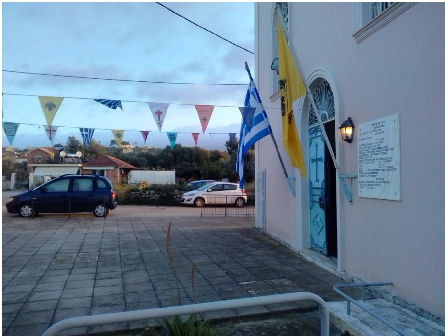
Φώτο: Εξωτερικός στολισμός στον Άγιο Αθανάσιο Σαρλάτων- Λειβαθούς. 18.01.2024