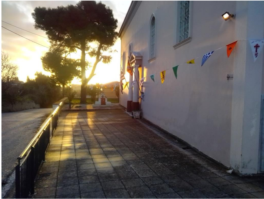
Φώτο: Εξωτερικός στολισμός στον Άγιο Αθανάσιο Σαρλάτων- Λειβαθούς. 18.01.2024