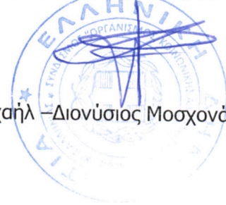
Μιχαήλ – Διονύσιος Μοσχονάς