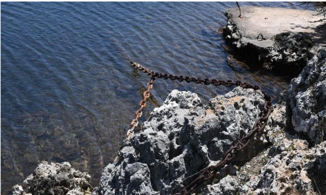
Οι αγκυρώσεις μέσα στον κόλπο.