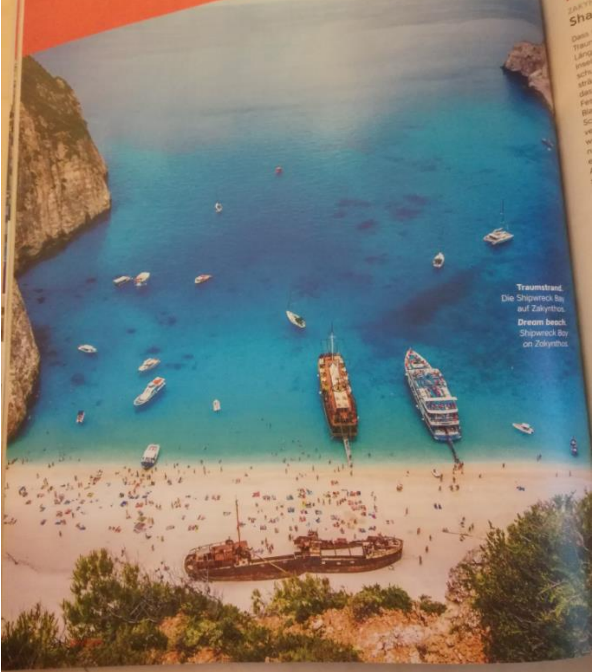
Traumstrand. Die Shipwreck Bay auf Zakynthos. Dream beach. Shipwreck Bay on Zakynthos.

Entdecken Sie die Welt mit Austrian Airlines Discover the world with Austrian Airlines