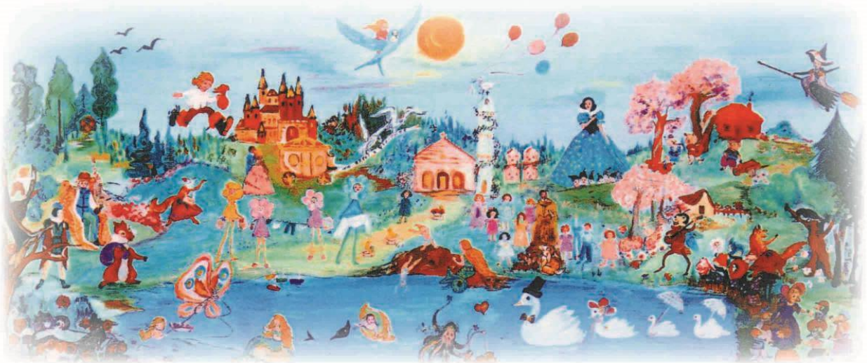
Εικ. 4. "Η Μάγισσα Πεπέ και τα Παραμύθια της", Πίνακας 2,00x0,80, Λαδομπογιά σε μουσαμά, Ευρώπη Μοσχονά - Μαραγκάκη, 2013.

ΘΕΜΑ : « Η Γλώσσα της Εικόνας στο Παραμύθι ».