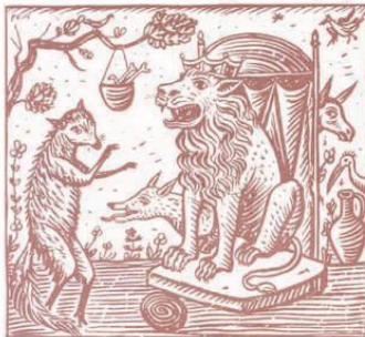
Εικ. 1. Λιοντάρι, λύκος κι αλεπού. (λαϊκό παραμύθι)

Ελληνικά Παραμύθια εκλογή του Γ.Α. Μέγα, τομ.Α, τομ.Β (εκδ. Εστία Ι.Δ.Κολλάρου)